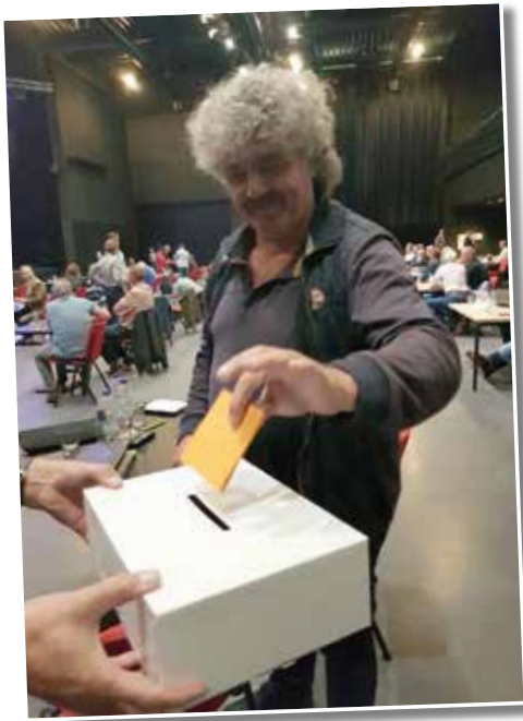
Hét stemmoment is aangebroken...